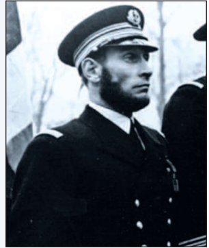
L'amiral Querville, spécialiste des missions difficiles

C'est à ce poste qu'il participe en 1944 au débarquement de Normandie comme commandant des escorteurs du groupe de débarquement américain « Chama » sur Omaha Beach . Il effectue 102 escortes de convois entre la Grande-Bretagne et la France. Le 22 juin 1944, son convoi est attaqué, de nuit, à la torpille, par une escadrille de Junkers 88. Son bâtiment parvient à la mettre en