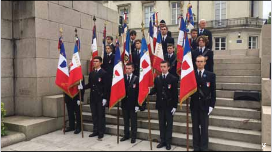
Les cadets en porte-drapeaux - Centenaire de la SMLH

et parrainer les recrues 1 . Ils ont adopté des mêmes insignes que les jeunes sapeurs-pompier (jaune en 2 e année, orange en 3 e et vert en 4 e ). Au fur et à mesure, les retours ont pris de l'ampleur et ainsi nous essayons d'appliquer les recommandations de plusieurs de nos grands chefs militaires : « Surtout, gardez-les ! » Début juillet 2022, la période bloquée rassemblait plus de 80 personnels.