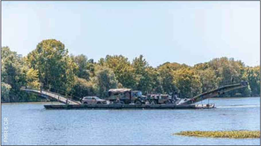
PFM dirigée par la 25 e CFR