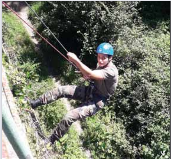
Descente en rappel

Une période bloquée est organisée début juillet et permet sur les quatre journées et les trois nuits passées sur le terrain, de suivre l'enseignement PSC1 (prévention et secours civiques de niveau 1) avec l'Union départementale des sapeurs-pompiers de Loire-At-