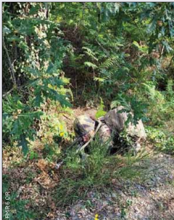
FMIR 6 CIR

posante réserve représente 400 réservistes répartis dans trois unités et quelques compléments individuels de réserve. Il s'agit de la plus grosse composante de réserve de l'armée de Terre attribuée à un régiment. Deux compagnies sont dédiées aux missions communes (5 e CIR, 6 e CIR) et une compagnie est spécialisée en franchissement sur pont flottant motorisé (25 e CFR).