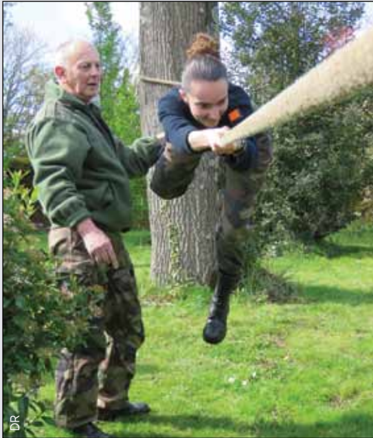
La tyrolienne simple

Notre satisfaction serait en demi-teinte si elle reposait uniquement sur la fierté, la générosité et l'envie de servir de nos cadets. Elle trouve également, depuis cette année, un contentement supplémentaire par notre contribution dans l'avènement, à Caen, d'une petite sœur : l'Académie des cadets de la Défense de Normandie.