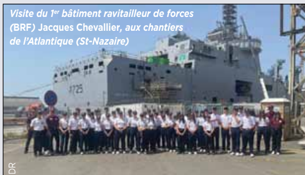
Visite du 1 er bâtiment ravitailleur de forces (BRF) Jacques Chevallier, aux chantiers de l'Atlantique (St-Nazaire)

Tout commence par le recrutement car la valeur d'une entité est l'Homme. Mon recrutement ainsi que celui de mon équipe est le point de départ d'une nouvelle et belle aventure humaine. Malgré les difficultés de recrutement, j'ai réussi, encore une fois, à créer cet esprit de cohésion, de bienveillance et de camaraderie aussi bien au sein de l'équipe d'encadrement que des jeunes volontaires. Nous