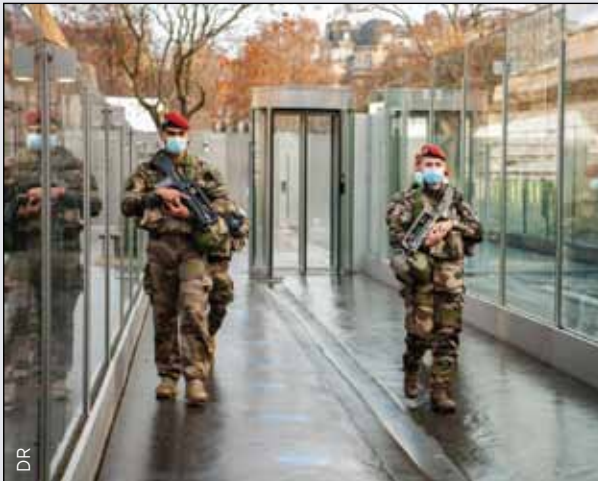
Sentinelle : les hommes du 3 e RMAT en patrouille

entreprise-défense » vont au contact des employeurs pour créer des synergies locales entre les forces armées et leur environnement socio-économique, au profit des réserves. Nous avons besoin de ce réseau humain qui connaît tant le milieu militaire que le monde de l'entreprise, de l'enseignement supérieur ou des collectivités territoriales. Ce sont des ambassadeurs très efficaces de l'engagement.