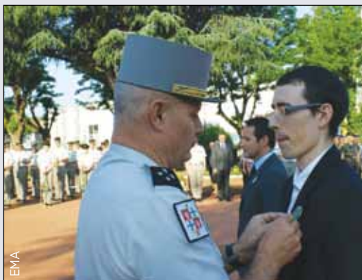
Accueil des nouveaux réservistes

tifs et de moyens lui donnant la capacité de conduire des missions opérationnelles. C'est un « échelon de concertation » dirigé par un secrétariat général et seulement destiné à fédérer les réserves des Armées, de la Gendarmerie et de la Police dans le but de renforcer leur rayonnement et leur attractivité.