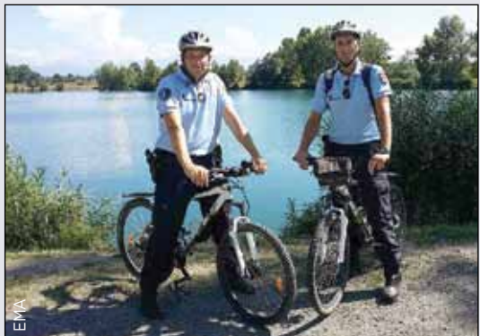
Patrouille de réservistes de la Gendarmerie

3/ Extrait du site du ministère des Armées